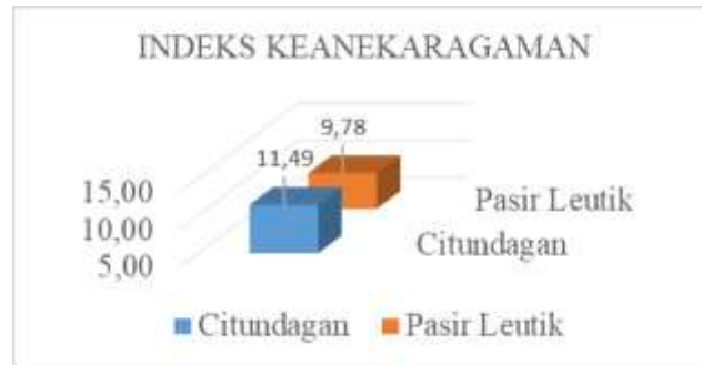
Gambar 1. Diagram Indeks Keaneekaragaman (H')

Berdasarkan analisis vegetasi pada semua tingkat pertumbuhan di Hutan Kemasyarakatan Citundagan dan Mata Air Pasir Leutik diperoleh nilai indeks keaneekaragaman (H') dengan nilai keaneekaragaman pakan lebah madu sebesar 11,45 yang berarti tinggi. Demikian pula di Mata Air Pasir Leutik Indeks keaneekaragaman jenis H' sebesar 9,78 artinya tinggi. Data yang diperoleh sesuai dengan kriteria pengukuran keaneekaragaman jenis, seperti yang dikemukakan oleh Shanon-Wiener dalam Nurdin (2019 yang menyatakan bahwa Jika H' > 3 maka keragaman jenis tinggi Jika 2 < H' < 3 maka keragaman jenis sedang Jika H' < 2 maka keaneekaragaman rendah.