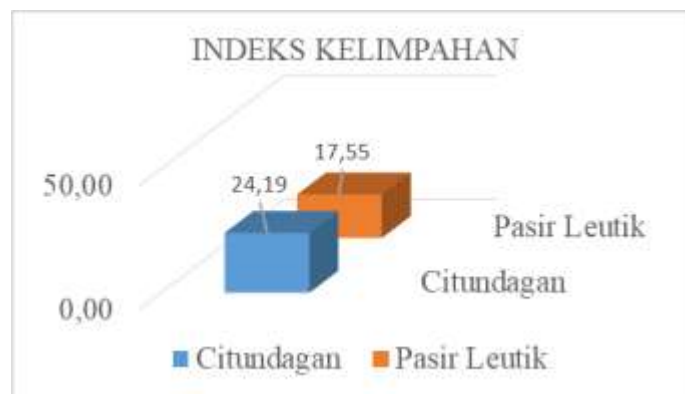
Gambar 2. Diagram Indeks Kelimpahan (E)

Indeks Kelimpahan Spesies (e) suatu area dapat memengaruhi seberapa merata populasi spesies yang berbeda di suatu habitat. (Nuraina I, et all , 2018).