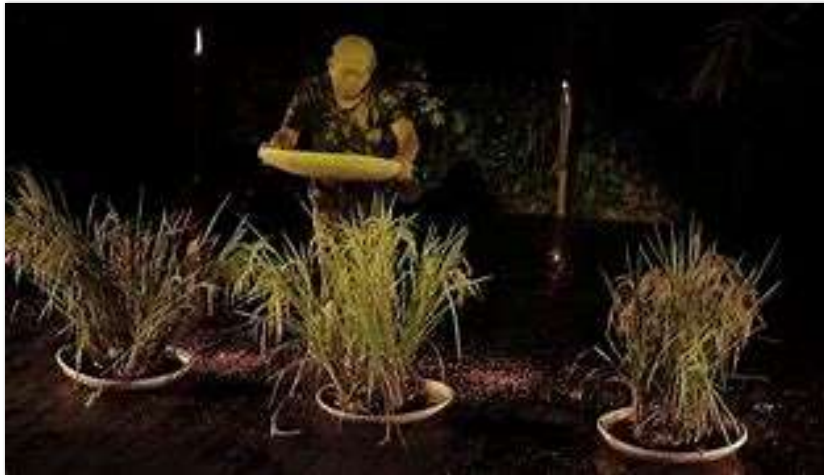
Gambar 2. Teater tubuh Tubuh Padi aktor & sutradara Rachman Sabur, Teater Payung Hitam

Petunjukan Tubuh Padi (karya, sutradara, & aktor Rachman Sabur, Teater Payung Hitam, Bandung) memperingatkan lahan yang semakin sempit sehingga area perawahan menjadi tidak ada sehingga padi di tanam di pot atau tampah saja. Lingkungan hidup persawahan yang semakin sempit dan jumlah buruh tani yang tak memiliki lahan bertani. Pengungkapan lahan bertani hanya di dalam lahan yang sempit. Cara menyuarakan penderitaan petani dengan material yang mudah di dapat dengan lima tampah dengan isi yang berbeda-beda yaitu tanah basah, bulir padi, dan tiga rumpun padi yang sudah berbuah. Penggunaan tata busana yang sederhana dan hanya berkaos seadanya. Aktor juga tidak memakai material tata rias khusus yang berupa make-up artis, pemeran cukup hadir apa adanya. Tata rambut juga apa adanya sehingga tidak perlu memakai wig dan bahan pengecat rambut lainnya. Pemeran tunggal dengan bahan artitsitik yang sederhana, dapat meminjam atau meminta dari warga sekitar dan memakai material di masyarakat sekitar.