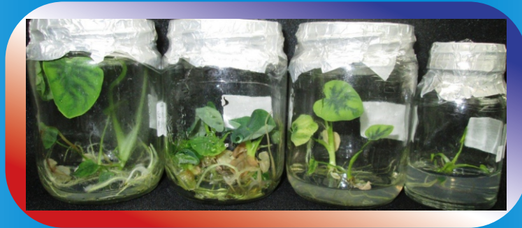
Penampilan Planlet Talas Umur 5 Bulan