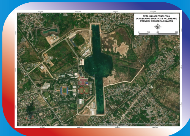
Konservasi Burung Di Jakabaring Sport City