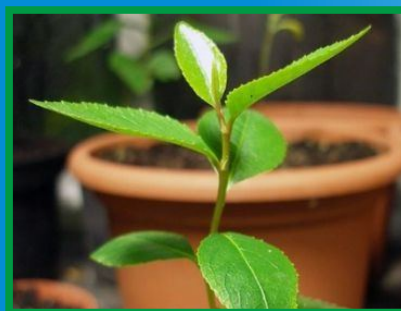
(a) (b) Tanaman Khat Merah (a) dan Hijau (b)