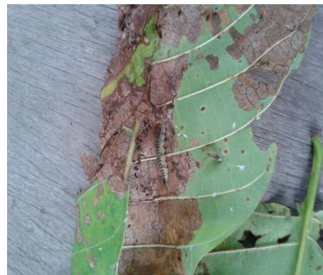
Gambar 5. Larva A. hilaralis

Adapun gejala serangan hama ini adalah terdapatnya lubang-lubang daun bekas gigitan larva. Awalnya larva menyerang tanaman dengan cara menggulung daun ke arah dalam kemudian larva akan menggigit daun. Serangan yang berat dapat mengakibatkan terjadi kerontokan daun dan tanaman menjadi gundul.