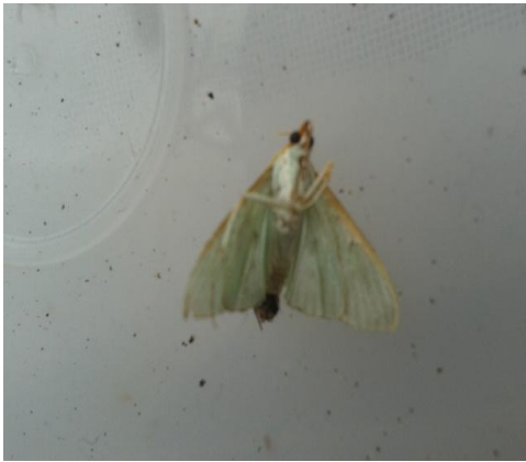
Gambar 6. Imago A. hilaralis