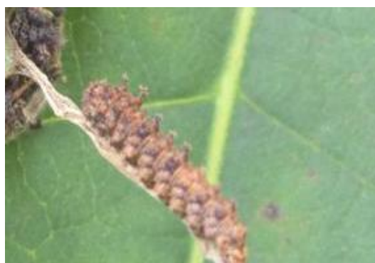
Gambar 2. Larva M. Procris