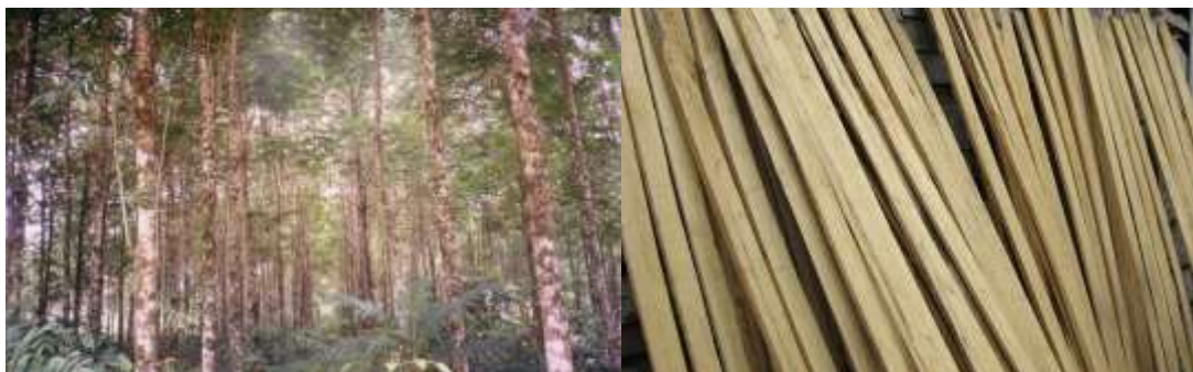
Gambar 2. Tanaman Sungkai Umur 12 Tahun (Kiri) dan Papan Sungkai (Kanan)

Menurut Sutisna dan Ruchaemi (1995), tanaman sungkai dapat dipanen sebagai kayu perkakas pada umur 20 – 30 tahun. Berdasarkan hasil penelitian ini, tanaman sungkai masih layak dipanen pada umur 20 – 30 tahun juga, namun berdasarkan kondisi saat ini, dimana teknologi pengolahan kayu telah berkembang pesat dan kayu sungkai berdiameter 10 – 20cm telah bernilai ekonomis, maka pemanen pada umur 15 tahun adalah yang paling layak dengan keuntungan finansial tertinggi. Penundaan pemanenan akan menambah biaya proyek dan kurang efisien.